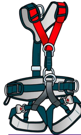
HARNAIS ANTICHUTE AVEC MAINTIEN AU TRAVAIL