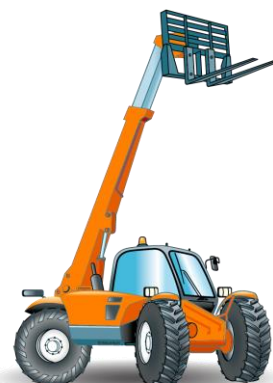
Catégorie F - Chariots de manutention Tout-terrain