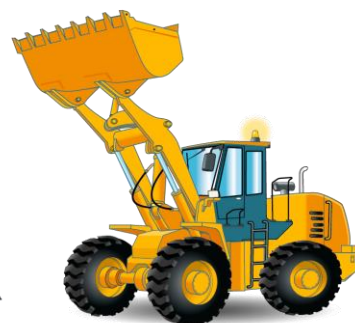
Catégorie C1 - Engins de chargement à déplacement alternatif