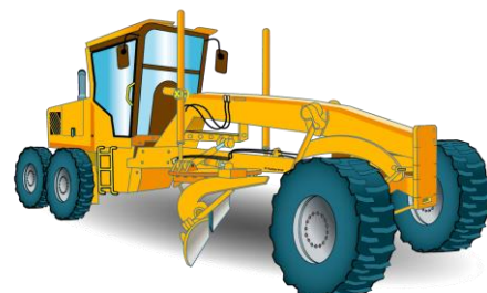
Catégorie C3 Engins de nivellement à déplacement alternatif