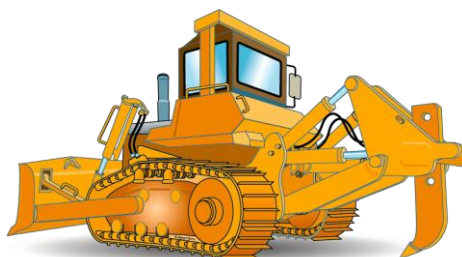
Catégorie C2 Engins de réglage à déplacement alternatif