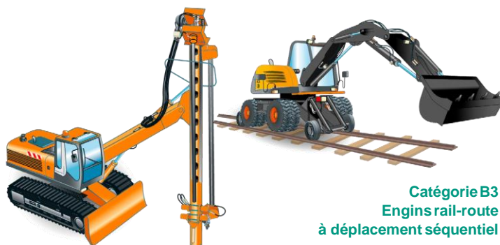
Catégorie B2 Engins de sondage ou de forage à déplacement séquentiel