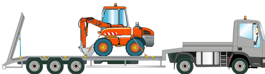
Catégorie G - Conduite des engins hors-production

Déplacement, chargement / déchargement sur porte-engins des engins de chantier des catégories A à F sans activité de production, pour démonstrations ou pour essais.