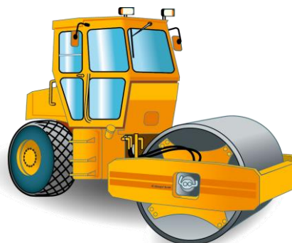
Catégorie D - Engins de compactage

ATLANTIQUE FORMATIONS SAS – Capital social : 30 000 euros