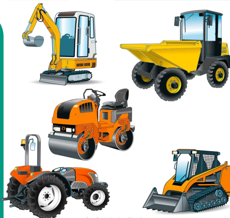
Catégorie A - Engins compacts