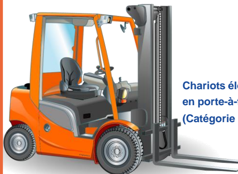
Chariots élévateurs frontaux en porte-à-faux (Catégorie 3)