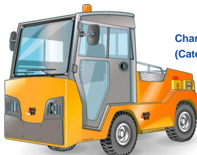
Chariots à plateau porteur (Catégorie 2A)

Chariot élévateur à mât muni de bras de fourche, sur lesquels la charge est placée en porte-à-faux par rapport aux roues et est équilibrée par la masse du chariot, dont la capacité nominale est supérieure à 6 tonnes.