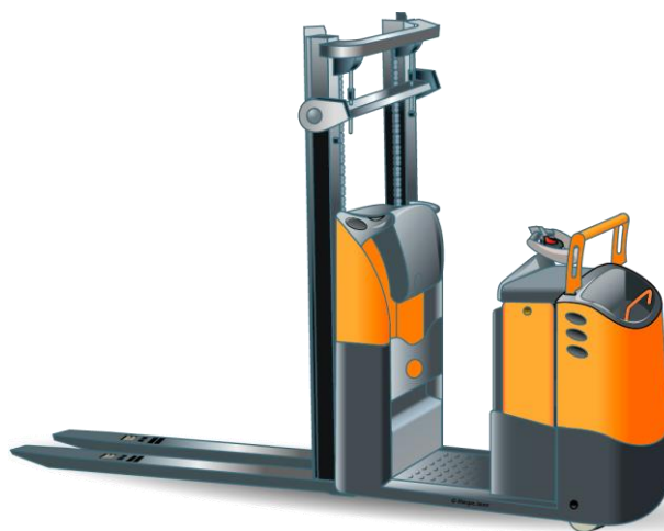
Gerbeurs à conducteur porté