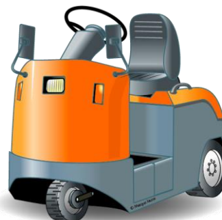
Chariots tracteurs industriels (Catégorie 2B)