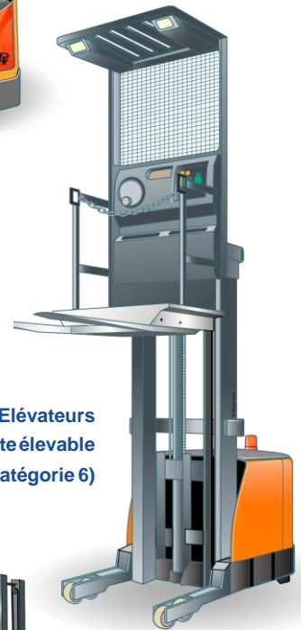
Chariots Élévateurs à poste de conduite élevable (Catégorie 6)