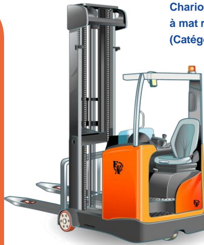
Chariots Élévateurs à mat rétractable (Catégorie 5)

Déplacement, chargement / déchargement sur porte-engins et transfert de chariots des catégories 1 à 6 sans activité de production, pour leur maintenance, pour démonstrations ou pour essais.