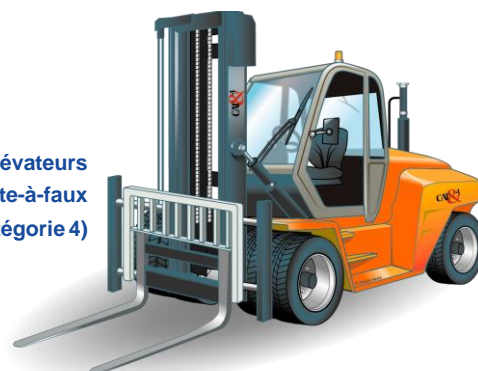
Chariots élévateurs frontaux en porte-à-faux (Catégorie 4)

ATLANTIQUE FORMATIONS SAS – Capital social : 30 000 euros