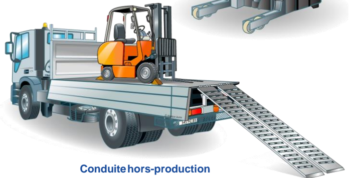
Conduite hors-production des chariots de toutes les catégories (Catégorie 7)

ATLANTIQUE FORMATIONS SAS – Capital social : 30 000 euros